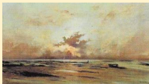
Environs de Villerville, marée basse, soleil couchant